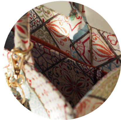
Kleine aufgesetzte Innentasche für zusätzlichen Stauraum