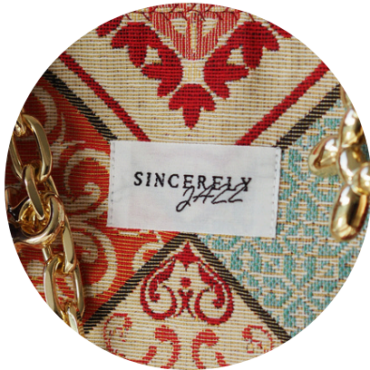
Webetikett mit Logo - für einen schönen Handmade-Charakter