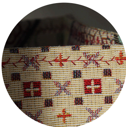
Dekorativer Zierstich in Kontrastfarbe - ein dezenter Hingucker