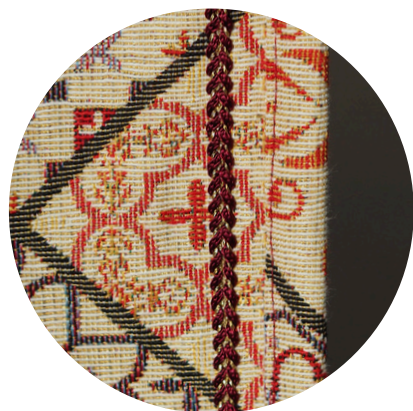
Passendes Zierband als rundumlaufendes, dekoratives Detail